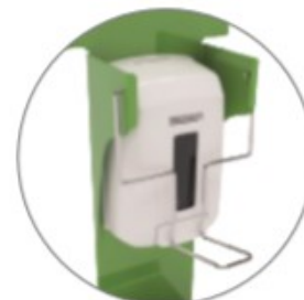
Barre de pression qualité premium