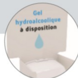
Plaque signalétique neutre (personnalisable en option)