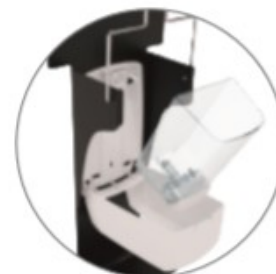
Réservoir transparent Pompe anti-gouttes

act-equipement@orange.fr mob : 06 16 98 78 34